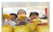
< あたごなし >