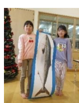
< ぶり実寸大写真 >