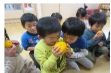
< ゆず >