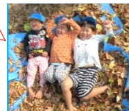
～うめ組～ 木の実や葉っぱを見つけたよ！