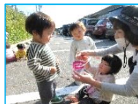
～さくらんぼ組～ どんぐりの音を 楽しんでいます！

寒さの本番はこれからですが、体調や年齢にあわせながら寒い時期もしっかり戸外で体を動かして遊んで、丈夫な体作りをします。また、感染症が流行する季節なので、うがいや手洗いをさらに徹底して予防に努めましょう。