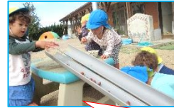
～さくら組～ どんぐりやまつぼっくりを 転がして遊んだよ！