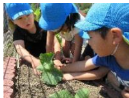
夏野菜の苗を植えました