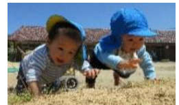
さくらんぼ組 所庭でハイハイ