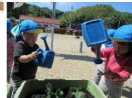
さくら組 真似して水やりをしています