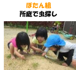
ぼたん組 所庭で虫探し