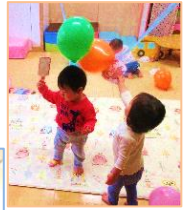
風船つき(さくらんぼ組)