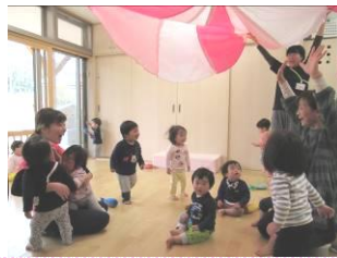
バルーンで遊んだよ (さくら組)

桜の木も若葉に変わり、緑がまぶしい季節になりました。入所、進級から一か月が経ち、子どもたちの表情も和らいできて、明るい笑い声や元気いっぱい遊ぶ姿がたくさんみられるようになりました。良い天気が続く、散歩に出かけたり所庭でしっかりと体を動かしたりしてたっぷり活動しています。今月は草花や生き物など身近な春の自然にふれながら、子どもたちの発見や興味を大切にしたり、戸外での遊びを十分に楽しんだりします。