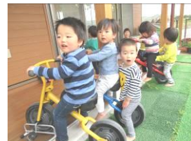
もみじ組さん不在の間に… 乗っちゃえ～ (もも組)