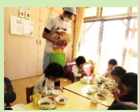
みんなで、いっしょに「いただきます！」

0～2歳児さんは給食の時間に絵本を読んだり、エプロン人形と一緒に挨拶したりしました。みんな、人形と一緒に上手にあいさつしていました。