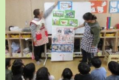
いろいろなひとが関わっているんだよ！

その日の給食の時間に、「先生、いつもおいしい給食ありがとう」「今日もおいしかったよ」と声をかけてくれる子もいました。みんな丁寧に「いただきます」と言って給食を美味しく食べていましたよ。